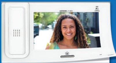
SÉRIE JP Portier vidéo JP, la protection idéale de votre logement