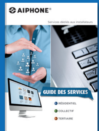
GUIDE DES SERVICES