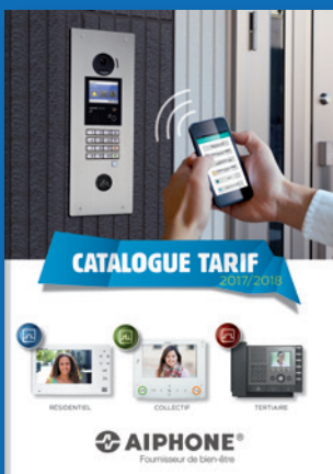
CATALOGUE GÉNÉRAL 2017/2018