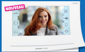
SÉRIE JO Wi-Fi Portier vidéo couleur moniteur Wi-Fi

DEMANDEZ NOS DOCUMENTATIONS POUR L'UTILISATEUR FINAL